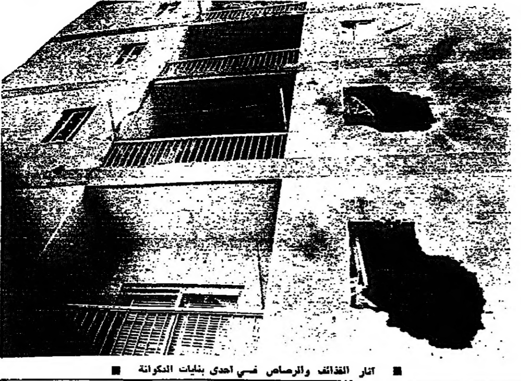
اتار القذافي والرصاص في احدى بنايات الذخيرة